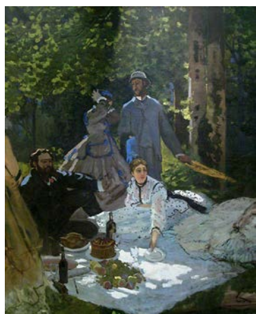
Доручак на трави

Својим начином сликања – девизионистичким, разлагањем светлости на основне боје-утицао је на своје слобенике. Позната дела су: