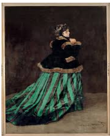
Жена у зеленој хаљини